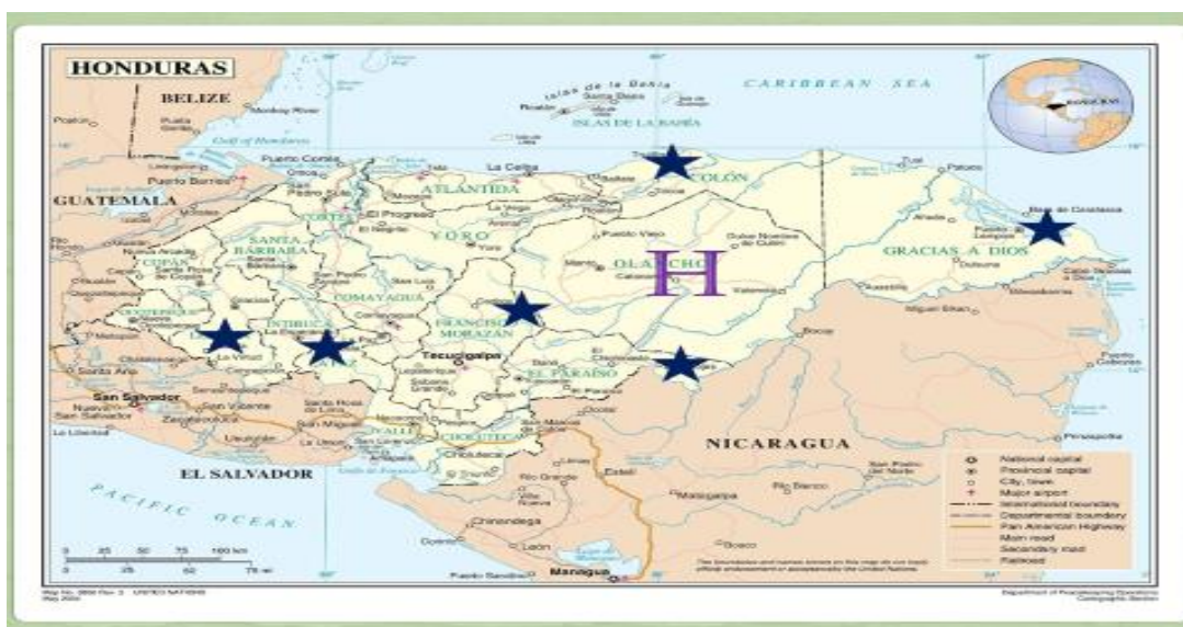
Acta CES 296-27 de noviembre-2015

Los centros regionales son parte del proceso de ampliación de la oferta académica prioritaria y estratégica que aprobó el Consejo Directivo Universitario (CDU), donde se contempla carreras a nivel de pregrado y de post grado, estableciéndose los vínculos nacionales e internacionales, para desarrollar dicha estrategia; reiterando el estricto cumplimiento de las leyes del país.